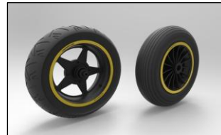
Roue moto - Roue ULM